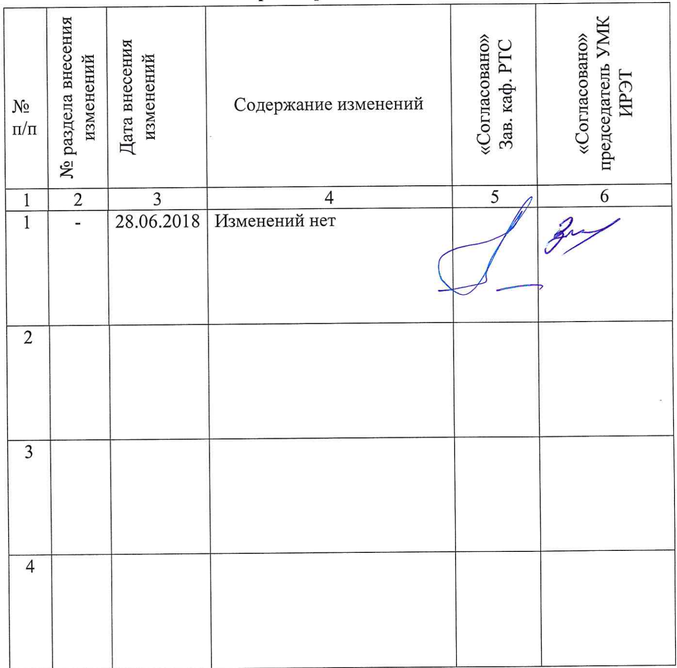
Лист регистрации изменений